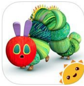
My very Hungry Caterpillar , lauréat 2015 des BolognaDigital Ragazzi Awards

noter que sur le site Internet de la Foire de Bologne, outre les noms des applis « nominées », la liste complète des candidats aux prix est publiée pays par pays . Tout ceci se révèle fort utile pour une veille internationale, avec le risque concomitant de frustration en découvrant que tel livre numérique... n'est pas disponible dans son propre pays ni dans sa propre langue 2 .