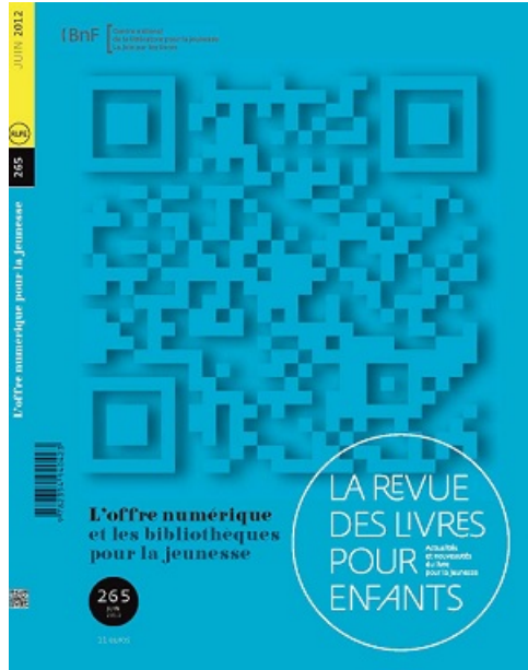
Couverture du n° 265 de la RLPE

Peu d'outils critiques de veille émanant de bibliothèques sont consacrés aux applications et livres numériques. Non que les bibliothèques ne s'y intéressent pas mais, contrairement à ce qui se passe pour l'édition traditionnelle, elles ne sont guère perçues par les éditeurs numériques comme des prescripteurs naturels. Il est donc plus compliqué pour elles de recevoir régulièrement des communiqués de parution, ou encore de recevoir des codes promotionnels permettant de tester les nouveautés. On peut cependant relever plusieurs initiatives :