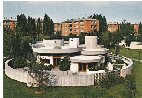
La petite Bibliothèque Ronde

La Petite Bibliothèque Ronde, ancienne bibliothèque de La Joie par les livres, est une bibliothèque pour enfants située à Clamart, en banlieue parisienne. Cette structure associative